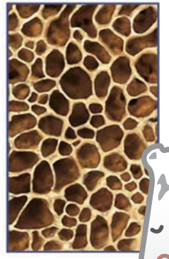
骨粗しょう症の人